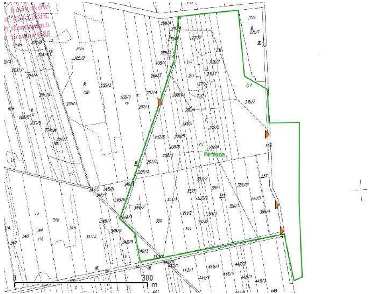
Lokalizacja zabudowy biologicznej w obrębie obiektu Perespa, obręb Dub, gmina Komarów Osada, powiat zamojski, województwo lubelskie.